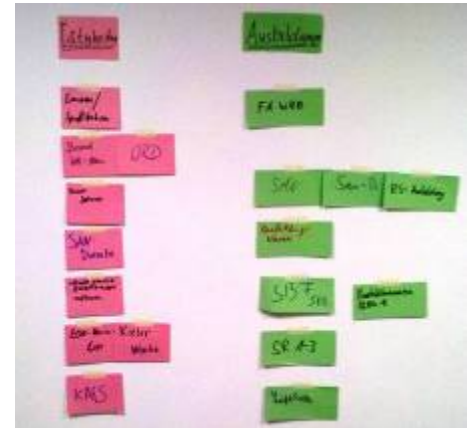
Ideensammlung beim ersten Treffen der Wasserrettungsgruppe.