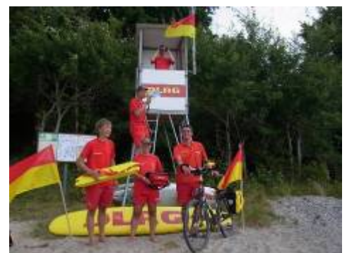
Wachmannschaft in Brodau.

Aber egal ob an der Küste oder am Binnensee, mit einem guten Team wird der Dienst am nächsten schnell zur großen Freude. NSch