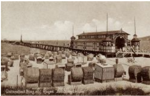
Landungsbrücke im Ostseebad Binz auf Rügen

Am 19. Oktober 2013 wird die DLRG 100 Jahre alt. In dieser Zeit ist aus ihr die größte ehrenamtliche Wasserrettungsorganisation der Welt geworden. Die Ertrinkungszahlen konnten seit dem von über 5000 zu Beginn des 20. Jahrhunderts auf unter 400 im Jahr 2012 gesenkt werden. Diese Zahl zeigt jedoch das auch heute noch jede Menge Arbeit auf die Mitglieder der DLRG wartet.