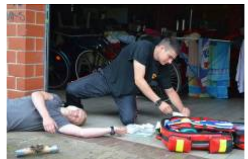
Übung an der Lohmühle.